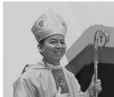
Archbishop Savio HONT Tai-Fai

於 12 月 27 日在渥太華聖神天主堂作彌撒主禮，並於晚上設宴與韓總主教共進晚餐。