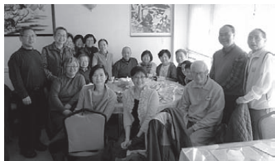
長青組二月十四日慶祝蛇年新春快樂的午餐敘會